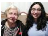
Bixenta Aduriz Escudero (1936)