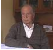
Angel Arriolabengoa (1932)